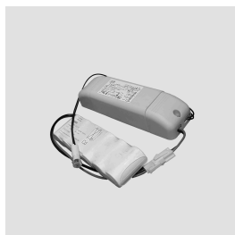
Kit di Emergenza Remoto Remoted Emergency Kit