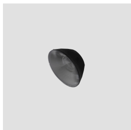
Ottica - 12° Optic Kit - 12°